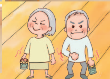
握力測定 力いっぱい握って下さい。