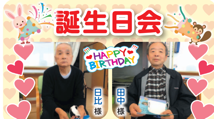
日 比 様