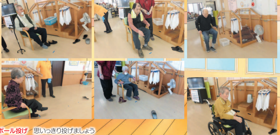
ボール投げ 思いっきり投げましょう