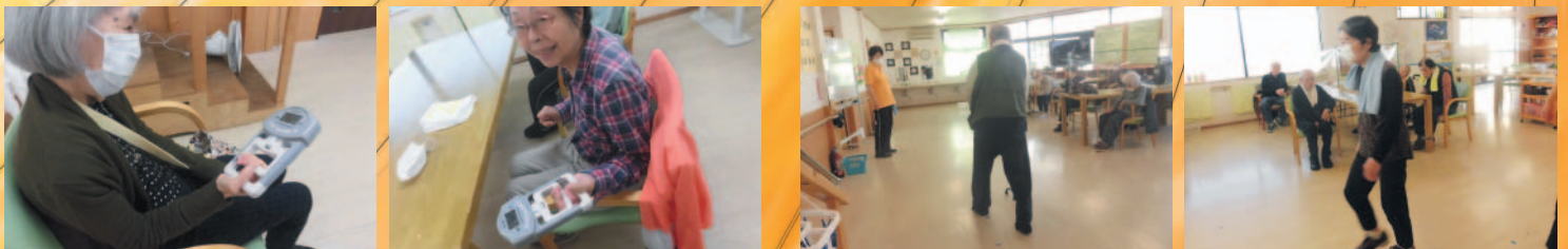
10m歩行 焦らず歩きましょう