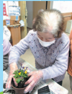
皆さんに可愛いお花を植えてもらいました*