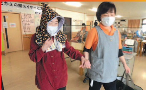
さあ、避難しますよ~