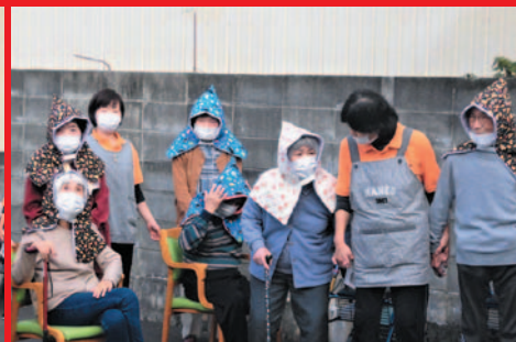
さー室内に戻りましょう。帰る時も安全に!