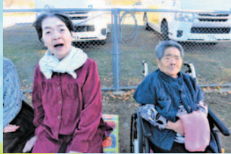
風は冷たいけど外は気持ちが良いね(^o^)/