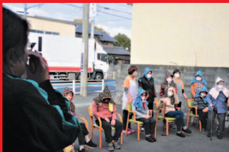
皆さんお疲れ様でした。