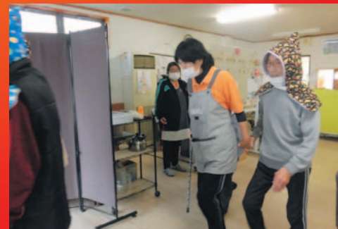
落ち着いて歩いてね。