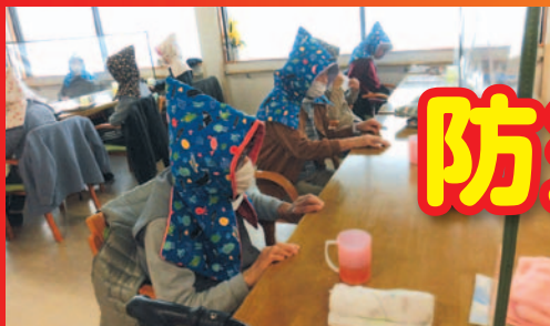
非常ベルが!! 頭巾をかぶって!