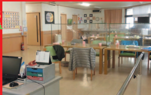
屋外へ全員避難しました!