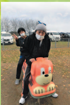
子供に帰って遊具で遊んでみました。