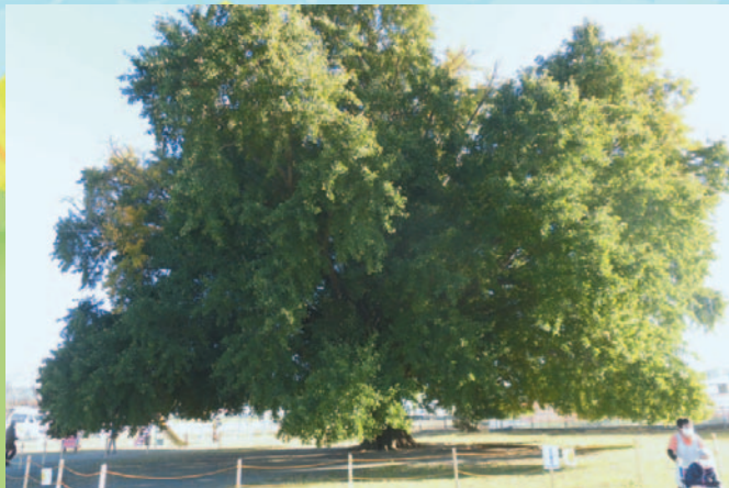
イチョウの大きさ分かるかな?!