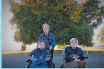
イチョウ大きいね！