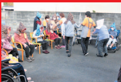
外にて待機中。頭は暖かいね(#^^#)