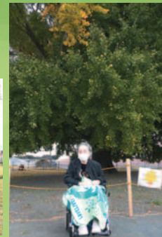
すまし顔にてパシャリ！