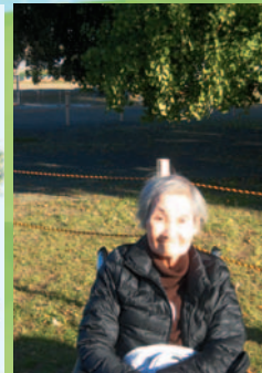
ちょっとまぶしい^m^