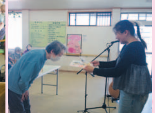
皆さんに手作りアクセサリのプレゼントをいただき、私たちからも写真入りの色紙を贈呈しました。