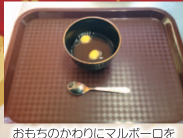
おもちのかわりにマルポーロを入れてみました(´ω`*)