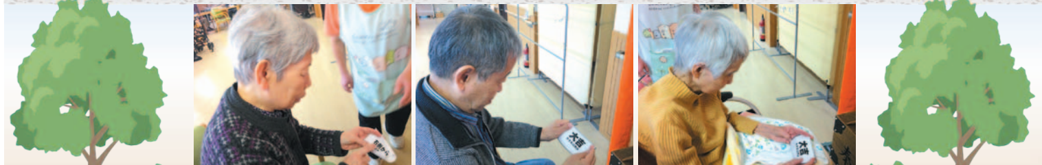
おみくじなんて書いてあるかな?