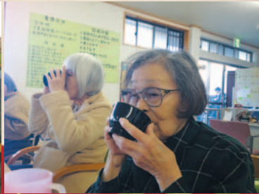
ぜんざい大好き(ω)ノ