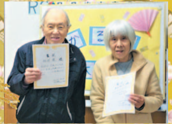
優勝してうれしいなー