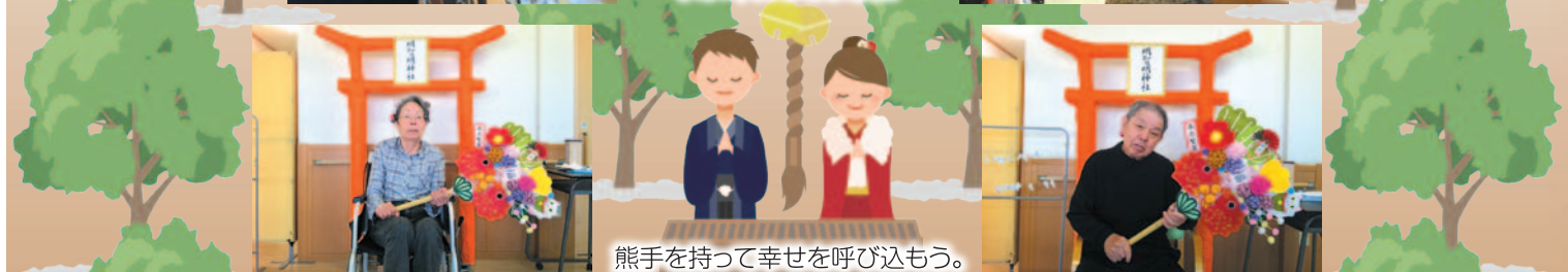
熊手を持って幸せを呼び込もう。