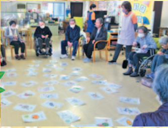
正解かるたの上にお手玉のせましよう