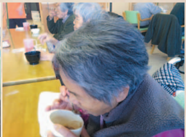
味わっていただくわ〜