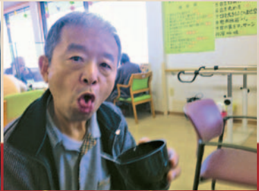
おかわりちょうだい😊