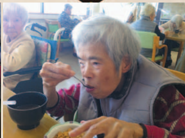
一口ずつゆっくりと