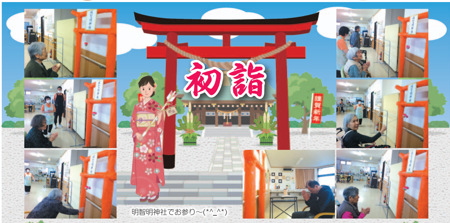
明智明神社でお参り~(*^_^*)

年のはじめの ためしとて 終わりなき世の めでたさを 松竹たてて かどごとに 祝うきょうこそ 楽しけれ 新年明けましておめでとうございます。今年もよろしくお祈りします。