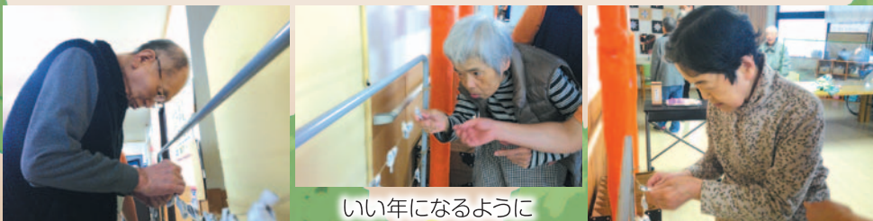
いい年になるように